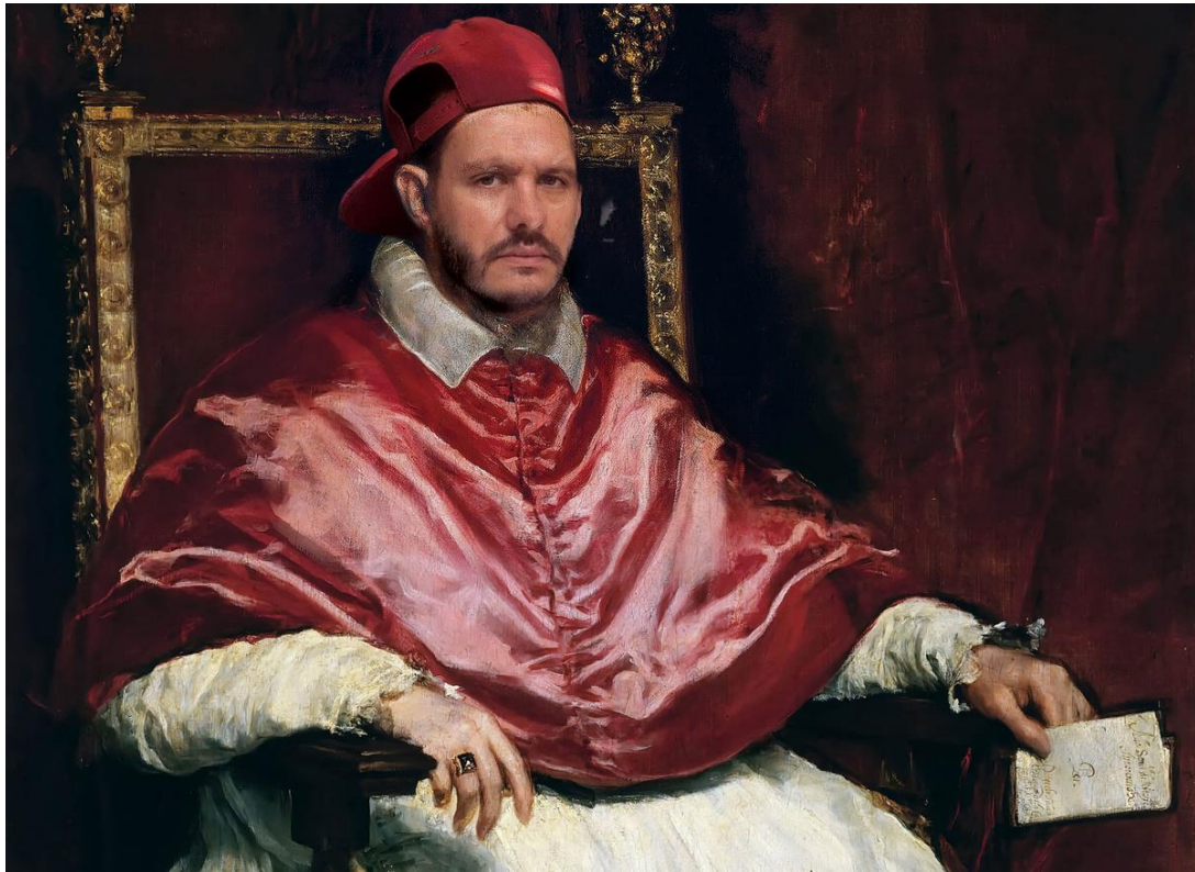
Đức Innocent X

Hơn hai thế kỷ sau, Pietro Vito Ottoboni, con trai của một trong những nhà lãnh đạo Cộng hòa Venice, là một nhà giáo luật lỗi lạc ở Trường Luật La mã (Rota Roma). Ngài được Đức Innocent X phong làm hồng y theo yêu cầu của dòng họ quý tộc Serenissima vào năm 1652, sau đó được bầu làm giáo hoàng vào tháng 10 năm 1689 ở tuổi 79, Ngài nhận danh hiệu Alexander VIII (1689-1691). Ngài gần như giữ kỷ lục là người lớn tuổi nhất vào thời điểm được bầu làm Giáo hoàng, sau này Đức Celestine V trở thành Giáo hoàng ở tuổi 85. Triều đại giáo hoàng của ngài chỉ kéo dài 15 tháng: Ngài thành lập các giáo phận Bắc Kinh và Nam Kinh, và là vị giáo hoàng cuối cùng của chế độ gia đình trị.