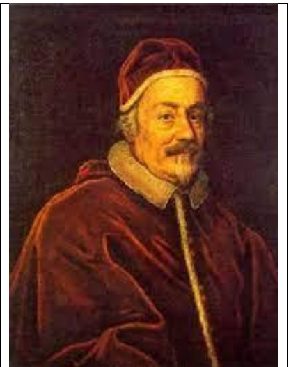
Đức Alexander VIII

Hơn hai thế kỷ sau, Pietro Vito Ottoboni, con trai của một trong những nhà lãnh đạo Cộng hòa Venice, là một nhà giáo luật lỗi lạc ở Trường Luật La mã (Rota Roma). Ngài được Đức Innocent X phong làm hồng y theo yêu cầu của dòng họ quý tộc Serenissima vào năm 1652, sau đó được bầu làm giáo hoàng vào tháng 10 năm 1689 ở tuổi 79, Ngài nhận danh hiệu Alexander VIII (1689-1691). Ngài gần như giữ kỷ lục là người lớn tuổi nhất vào thời điểm được bầu làm Giáo hoàng, sau này Đức Celestine V trở thành Giáo hoàng ở tuổi 85. Triều đại giáo hoàng của ngài chỉ kéo dài 15 tháng: Ngài thành lập các giáo phận Bắc Kinh và Nam Kinh, và là vị giáo hoàng cuối cùng của chế độ gia đình trị.